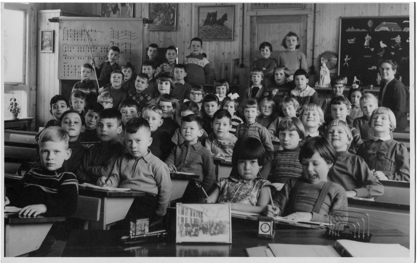
klasfoto in Gorinchem ca 1960-1965, toen geluk nog heel gewoon

Het zal je kind maar wezen dat door allochtonen wordt opgejaagd, ingesloten en in de vernieling geslagen en getrapt. Terreur in onze scholen in onze straten, en de overheid en justitie doen niets. Hun prioriteit ligt in het monddood maken van diegenen die dit aanklagen en daadkrachtige actie eisen. Beelden van deze maand uit Gorinchem ook bekend als Gorkum in Nederland, een gemeente met ca 39000 inwoners, waar het leven ooit vreedig en het geluk heel gewoon was. De immigratie en de kinderrijke gezinnen daaruit voortgesproten hebben daar definitief een einde aan gemaakt.