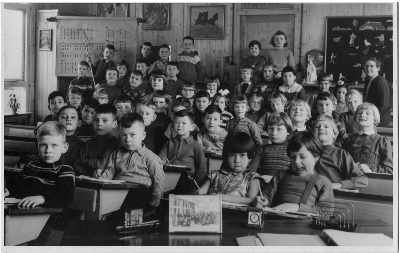
klasfoto in Gorinchem ca 1960-1965, toen geluk nog heel gewoon was

Het zal je kind maar wezen dat door allochtonen wordt opgejaagd, ingesloten en in de vernieling geslagen en getrapt. Terreur in onze scholen in onze straten, en de overheid en justitie doen niets. Hun prioriteit ligt in het monddood maken van diegenen die dit aanklagen en daadkrachtige actie eisen. Beelden van deze maand uit Gorinchem ook bekend als Gorkum in Nederland, een gemeente met ca 39000 inwoners, waar het leven ooit vredig en het geluk heel gewoon was. De immigratie en de kinderrijke gezinnen daaruit voortgesproten hebben daar definitief een einde aan gemaakt.