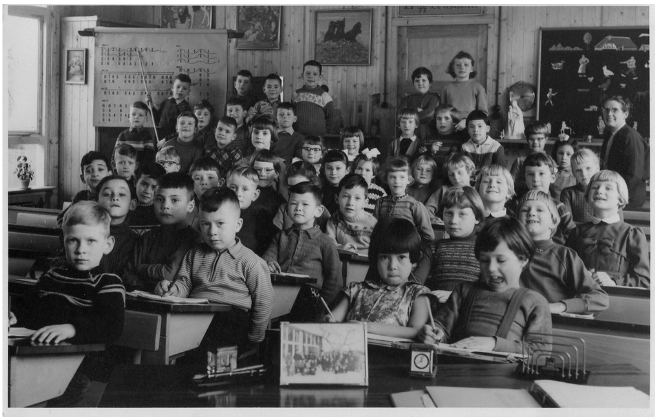
klasfoto in Gorinchem ca 1960-1965, toen geluk nog heel gewoon

Het zal je kind maar wezen dat door allochtonen wordt opgejaagd, ingesloten en in de vernieling geslagen en getrapt. Terreur in onze scholen in onze straten, en de overheid en justitie doen niets. Hun prioriteit ligt in het monddood maken van diegenen die dit aanklagen en daadkrachtige actie eisen. Beelden van deze maand uit Gorinchem ook bekend als Gorkum in Nederland, een gemeente met ca 39000 inwoners, waar het leven ooit vredig en het geluk heel gewoon was. De immigratie en de kinderrijke gezinnen daaruit voortgesproten hebben daar definitief een einde aan gemaakt.